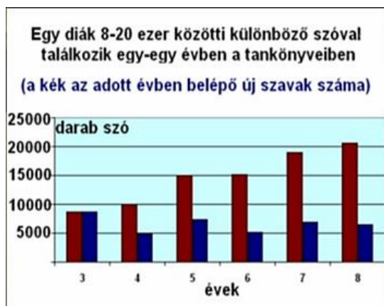
1. ábra: A tankönyvekben szereplő szavak száma adott évfolyamon. (Varga, é.n.)

Egy ötödikes diák a tankönyveiben összesen 15 000 szóval találkozik, amiből kb. 8000 az új szó. Bár a szókincsismeret még önmagában nem garantálja a szövegértést, azonban annak nagymértékű hiánya egyértelműen akadályozza azt. A részletes összehasonlításokból kiindulva arra jutottak, hogy nagy különbségek vannak az egyes kiadók tankönyveiben szereplő szókészlet között is, nemkülönben az egyes évfolyamokban előforduló szavak közt. Vagyis: a tanulók sok ezer új szóval találkoznak az egyes évfolyamokban, miközben sok ezer szóval nem találkoznak, amit a korábbi év(ek)ben tanultak. A szavak mentális lexikonba való beépüléséhez nélkülözhetetlen, hogy az új szó többször ismétlődjön különböző kontextusokban.